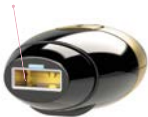
El filtro de vidrio

SmoothSkin Bare+ es un dispositivo para un solo usuario. No es específico de un género, por lo tanto, es apropiado para los hombres. No se recomienda la utilización de SmoothSkin Bare+ en la barba masculina ya que los resultados pueden ser permanentes.